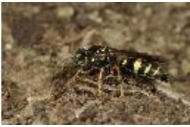
Gorytes laticinctus (Lepelletier, 1832), Weibchen