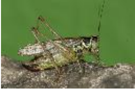
Roesels Beißschrecke - Metrioptera roeselii (Hagenbach, 1822), adultes Weibchen