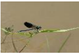
Gebänderte Prachtlibelle - Calopteryx splendens (Harris, 1782), Männchen