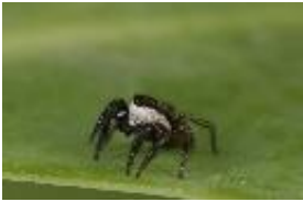
Phlegra lineata (C.L. Koch, 1846), adultes Männchen