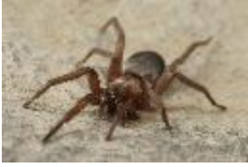
Scotophaeus quadripunctatus (Linnaeus 1758), adultes Weibchen