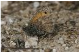
Kleiner Heufalter, Kleines Wiesenvögelchen, Coenonympha pamphilus (Linné, 1758).