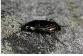
Verschiedenfarbiger Buntgrabläufer - Poecilus (Poecilus) versicolor (Sturm, 1824), Männchen