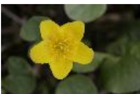
Sumpfdotterblume - Caltha palustris L.