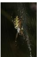
Wespenspinne - Argiope bruennichi (Scopoli, 1772), Weibchen