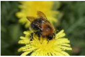
Baumhummel - Bombus hypnorum (Linnaeus, 1758)