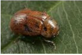
Gonioctena (Goniomena) quinquepunctata (Fabricius, 1787)