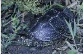
Emys orbicularis (Linnaeus, 1758) - Europäische Sumpfschildkröte