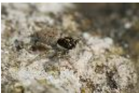
Menemerus semilimbatus (Hahn, 1827), adultes Weibchen