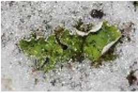
Apfelflechte, Schwarzwarzige Schildflechte - Peltigera aptosa (L.) Willd