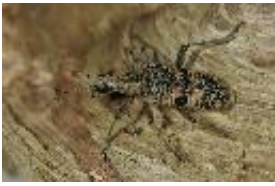
Schwarzfleckiger Zangenbock, Laubholzzangenbock - Rhagium (Megarhagium) mordax (De Geer, 1775), Weibchen