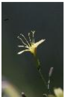
Mauerlattich - Mycelis muralis (L.) Dumort.