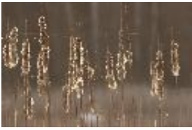
Schmalblättriger Rohrkolben - Typha angustifolia L. - Röhricht im Gegenlicht.