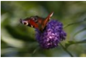
Tagpfauenauge - Inachis io (Linnaeus, 1758), syn. Nymphalis i.