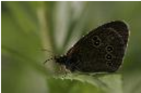
Schornsteinfeger - Aphantopus hyperantus (Linnaeus, 1758), Männchen