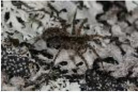
Pardosa saltans (Töpfer-Hofmann, 2000), adultes Weibchen