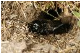
Feldgrille - Gryllus campestris Linnaeus, 1758, subadultes Weibchen