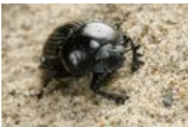
Gestreifter Pillendreher - Scarabaeus (Ateuchetus) laticollis Linnaeus, 1767