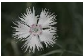
Türken-Nelke - Dianthus anatolicus Boiss.