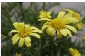
Steirodiscus tagetes (L.) Schltr.