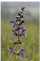
Wiesensalbei - Salvia pratensis L., 1753