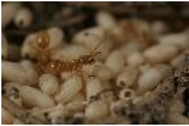
Gelbe Wiesenameise - Lasius (Cautolasius) flavus (Fabricius, 1782)