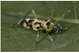
Variabler Widderbock - Chlorophorus varius (Müller, 1766)