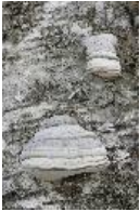
Zunderschwamm - Fomes fomentarius (L.) J.J. Kickx 1867, auf Birkenstamm