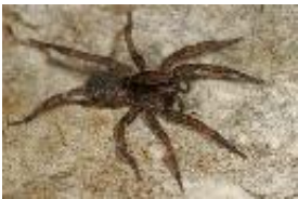
Trochosa terricola Thorell, 1856, adultes Weibchen