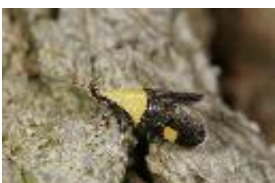
Oecophora bractella (Linnaeus, 1758)