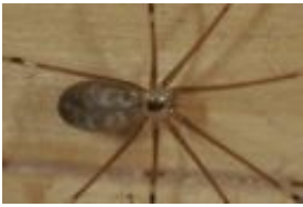
Große Zitterspinne - Pholcus phalangioides (Fuesslin, 1775), adultes Weibchen