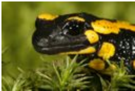
Feuersalamander - Salamandra salamandra (Linnaeus, 1758)