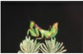
Ameles spallanzania (Rossi, 1792), adultes Weibchen