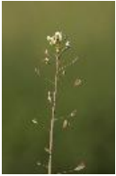
Gewöhnliches Hirtentäschel, Hirtentäschelkraut - Capsella bursa-pastoris (L.) Medik.