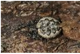
Nuctenea silvicultrix (C.L. Koch, 1835), subadultes Weibchen