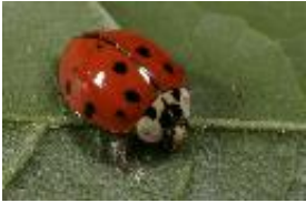
Asiatischer Marienkäfer - Harmonia axyridis (Pallas, 1771)