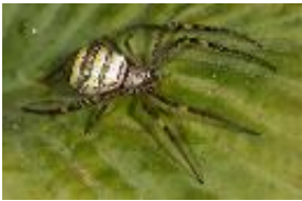
Saint Andrew's Cross Spider - Argiope aetherea (Walckenaer, 1842), adultes Weibchen