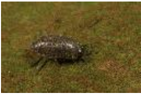
Philoscia muscorum (Scopoli, 1763)