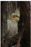
Nymphensittich - Nymphicus hollandicus Kerr, 1792