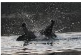
Blässhuhn - Fulica atra Linnaeus, 1758