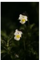
Acker-Stiefmütterchen - Viola arvensis Murray