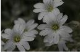
Filz-Hornkraut - Cerastium tomentosum L.