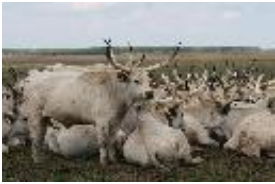
Ungarisches Steppenrind, Ungarisches Graurind, Szürkemarha, Szilaj - Bos primigenius Bojanus, 1827