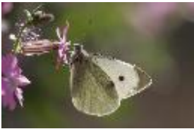
Großer Kohl-Weißling - Pieris brassicae (Linnaeus, 1758). Weibchen an Blüte saugend.