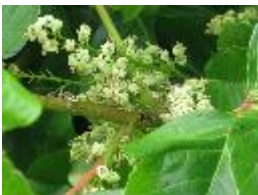
Giftsumach - Toxicodendron radicans Kuntze