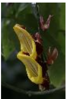
Himmelsblume - Thunbergia mysorensis (Wight) T. Anderson ex Bedd.