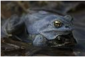
Moorfrosch - Rana arvalis Nilsson, 1842