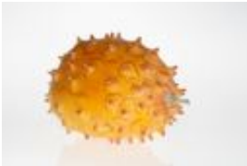
Horngurke, Kiwano - Cucumis metuliferus E.Mey. ex Naudin