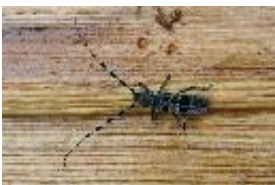
Alpenbock - Rosalia alpina (Linnaeus, 1758)