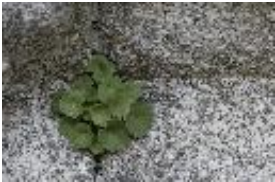
Mauer-Zimbelkraut - Cymbalaria muralis G.Gaertn. et al.