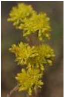
Zierliche Fetthenne - Sedum forsterianum Sm.