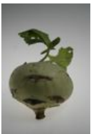
Kohlrabi - Brassica oleracea L. convar. acephala (DC.) Alef. var. gongylodes L., Sprossknolle