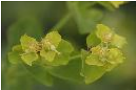
Glanz-Wolfsmilch - Euphorbia lucida Waldst. et Kit.