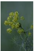
Zypressen-Wolfsmilch - Euphorbia cyparissias L.