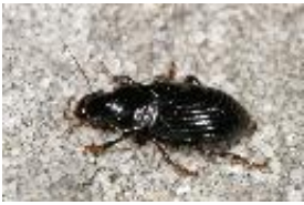
"Beschuhter" Schnellläufer - Pseudoophonus (Platus) calceatus (Duftschmid, 1812), Männchen