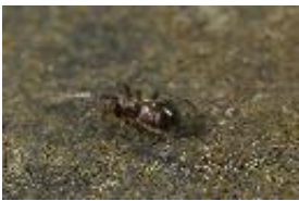
Phrurolithus festivus (C.L. Koch, 1835), Weibchen