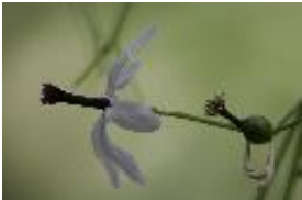
Indischer Flieder oder Zedrachbaum - Melia azedarach Blanco