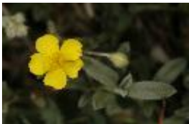
Grau-Sonnenröschen - Helianthemum canum (L.) Baumg.