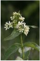
Echter Steinsame, Eisenkraut, Himmelstütze, Meergries, Meerhirse, Steinhirse, Steinsame, Steinsaat, Teebusk - Lithospermum officinale L.