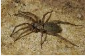
Nomisia aussereri (L. Koch, 1872), adultes Weibchen