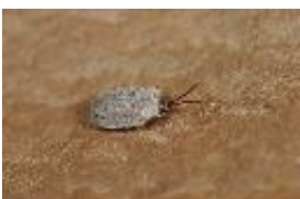
Stachelkäfer - Dicladispa testacea (Linnaeus, 1767)