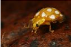
Sechzehnleckiger Marienkäfer - Halyzia sedecimguttata (Linnaeus, 1758)