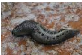
Limax cinereoniger Wolf, 1803 - Schwarzer Schneigel