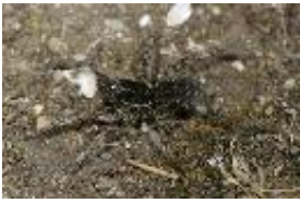
Geolycosa vultuosa (C.L. Koch, 1838)