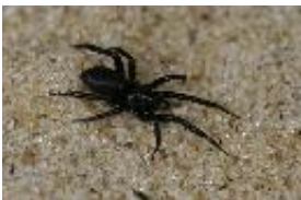
Drassyllus praeficus (L. Koch, 1866), adultes Weibchen