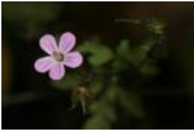
Ruprechtskraut, Stinkender Storchschnabel - Geranium robertianum L