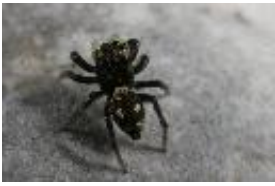
Heliophanus sp., subadultes Weibchen