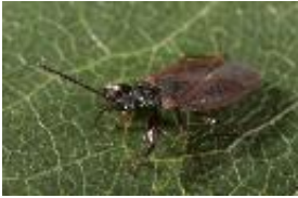
Kiefernzapfenwanze - Gastrodes grossipes (De Geer, 1773)