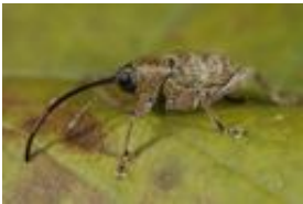
Eichelbohrer - Curculio (Curculio) venosus (Gravenhorst, 1807), Weibchen