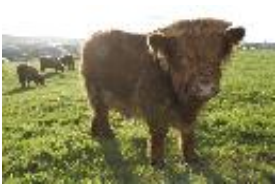
Schottisches Hochlandrind, Highland, Kyoie - domestizierte Art Bos primigenius Bojanus, 1827