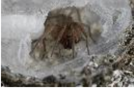
Drassodes cupreus (Blackwall, 1834), Weibchen mit 58 Nachkommen