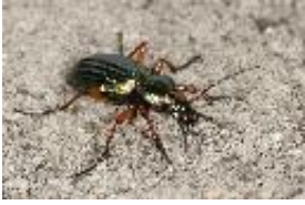
Goldglänzender Laufkäfer - Carabus (Chrysocarabus) auronitens Fabricius, 1792, Männchen