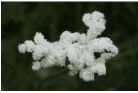
Kleines Mädesüß, Knollen-Mädesüß - Filipendula vulgaris Moench