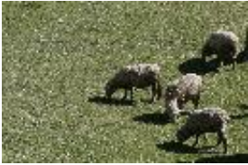
Hausschaf - domestizierte Art Ovis aries Linnaeus, 1758.