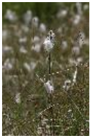
Schmalblättriges Wollgras - Eriophorum angustifolium Honck.