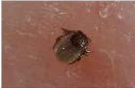
Gemeiner Holzbock - Ixodes ricinus (Linnaeus, 1758)