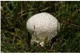
Wiesenstäubling, Wiesen-Staubbecher - Vascellum pratense (Pers.: Pers.) Kreisel 1962