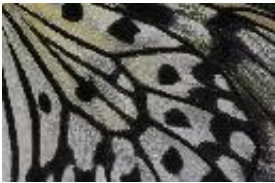
Flügeldetail der Weißen Baumnymphe - Idea leuconoe (Erichson, 1834)