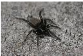
Gnaphosa leporina (L. Koch, 1866), adultes Männchen