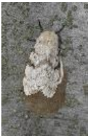
Schwammspinner - Lymantria dispar (Linnaeus, 1758), Weibchen mit seinem Gelege