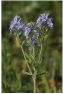
Österreichische Ehrenpreis - Veronica austriaca L.