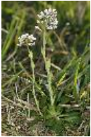
Kahle Gänsekresse, Turmkraut - Arabis glabra (L.) Bernh. (syn. Turritis g. )