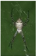
Argiope trifasciata (Forskäl, 1775), adultes Weibchen