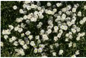
Gänseblümchen, Maßliebchen, Tausendschön - Bellis perennis L.