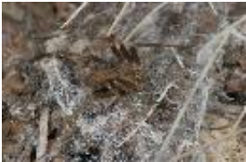
Loxosceles rufescens (Dufour, 1820), adultes Weibchen