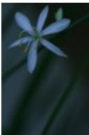
Grünlilie - Chlorophytum comosum (Thunb.) Jacques