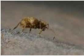
Messingkäfer - Niptus hololeucus (Faldermann, 1835)