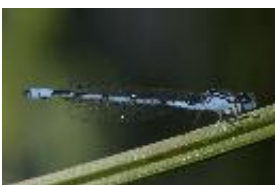
Gemeine Becherjungfer, Becher-Azurjungfer - Enallagma cyathigerum (Charpentier, 1840), Männchen