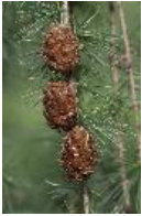
Hängelärche - Larix x pendula (Ait.) Salisb. (Hybrid aus Ostamerikanischer Lärche, L. laricina und Europäischer Lärche, L. decidua )