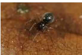
Erigone dentipalpis (Wider, 1834), adultes Weibchen