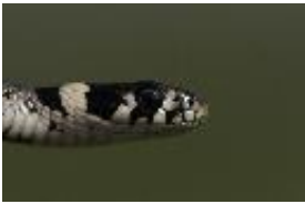
Ringelnatter - Natrix natrix (Linnaeus, 1758)