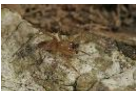
Clubiona terrestris Westring, 1851, adultes Männchen