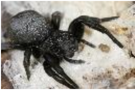
Mittelmeer-Röhrenspinne - Eresus walckenaeri Brulle, 1832, Weibchen.