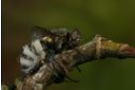
Fliegentöter - Entomophthora muscae (Cohn) Fresen. 1856, syn. E. schizophorae , ein insektenpathogener Pilz, der eine Muscidae befallen hat.