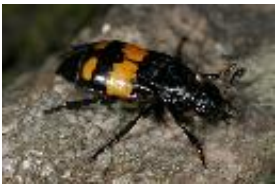
Schwarzhörnige-, Schwarzfühlerige Totengräber - Nicrophorus vespilloides Herbst, 1783, Männchen