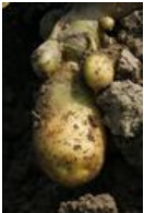
Kartoffel, Erdapfel - Solanum tuberosum L., Spross-Knollen eines Stolo