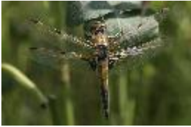
Vierfleck - Libellula quadrimaculata Linnaeus, 1758, Männchen