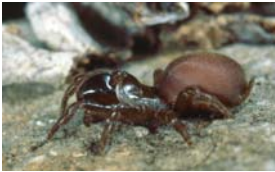
Tapezierspinne - Atypus muralis Bertkau, 1890, adultes Weibchen