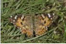
Distelfalter - Vanessa cardui (Linnaeus, 1758)