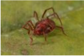
Erythraeus phalangoides (De Geer, 1778)