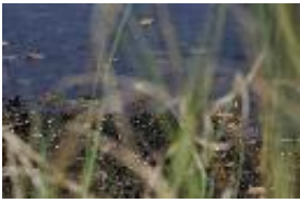
Braune Mosaikjungfer - Aeshna grandis (Linnaeus, 1758), Weibchen bei der Eiablage