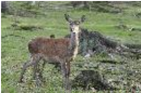
Rothirsch - Cervus elaphus Linnaeus, 1758