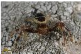
Südliche Glanz-Krabbenspinne - Synema globosum (Fabricius, 1775), juvenil