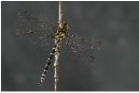
Blaugrüne Mosaikjungfer - Aeshna cyanea (Müller, 1764), Männchen