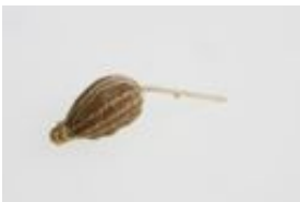
Anis - Pimpinella anisum L., einzelne Teilfrucht der Spaltfrucht