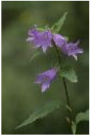
Nesselblättrige Glockenblume - Campanula trachelium L.