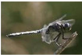
Kleiner Blaupfeil - Orthetrum coerulescens Fabricius, 1758, Männchen