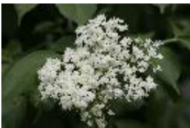
Schwarzer Holunder - Sambucus nigra L.