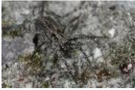
Alopecosa albofasciata (Brullé, 1832), adultes Weibchen