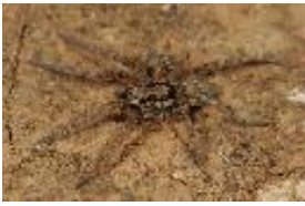
Hogna balearica (Thorell, 1873), adultes Männchen