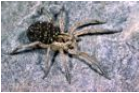
Schwarzbäuchige Tarantel - Hogna radiata (Latreille, 1817), Weibchen mit Jungspinnen