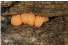
Blutmilchpilz - Lycogala epidendrum (J.C. Buxb. ex L.) Fr., 1817