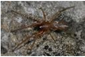
Harpactea rubicunda (C.L. Koch, 1838), adultes Weibchen