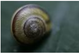
Garten-Bänderschnecke, Weißmündige Bänderschnecke, Garten-Schnirkelschnecke - Cepaea hortensis (O. F. Müller, 1774)