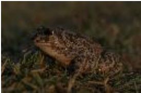
Pelobates fuscus (Laurenti, 1768) - Knoblauchkröte