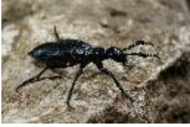
Violetter Ölkäfer, Violetter-, Blauer Maiwurm - Meloe (Meloe) violaceus Marsham, 1802, Männchen