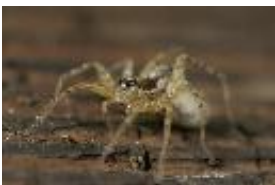
Pardosa agrestis (Westring, 1861), adultes Weibchen mit Kokon