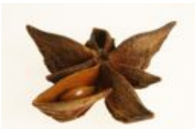
Echter Sternanis - Illicium verum Hook. f., quirlig stehende Balgfrüchte