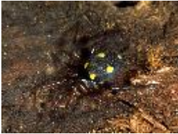
Zeltdachspinne - Uroctea durandi (Latreille, 1809), adultes Weibchen