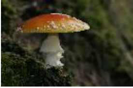
Fliegenpilz - Amanita muscaria var. muscaria (L.) Hook.