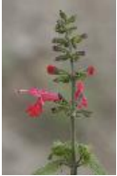
Scharlachroter Salbei - Salvia coccinea P.J. Buchoz ex Etlinger