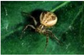
Xysticus striatipes L. Koch, 1870, adultes Weibchen