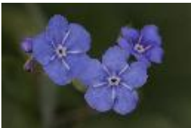
Kaukasus-Vergissmeinnicht - Brunnera macrophylla (Adams) I.M.Johnst.