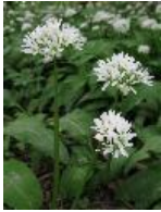
Bärlauch - Allium ursinum L.