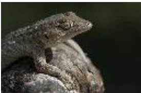
Mauergecko - Tarentola mauritanica (Linnaeus, 1758)