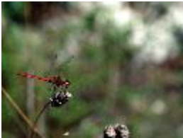
Südliche Heidelibelle - Sympetrum meridionale (Selys, 1841)