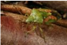
Buntrock - Cyphostethus tristriatus (Fabricius, 1787)