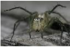
Luchsspinne - Oxyopes lineatus Latreille, 1806, adultes Weibchen