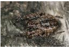
Spaltenkreuzspinne - Nuctenea umbratica (Clerck, 1758), adultes Weibchen auf Birkenstamm