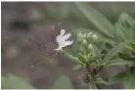
Spinnenpflanze - Cheleome chilensis DC.