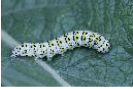
Raupe von Shargacucullia verbasci (Linnaeus, 1758) - Brauner Mönch/Königskerzen-Mönch