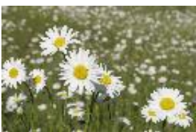
Magerwiesen-Margerite, Wiesen-Margerite, Wiesen-Wucherblume - Leucanthemum vulgare Lam.