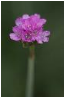
Strand-Grasnelke - Armeria maritima (P. Mill.) Willd.