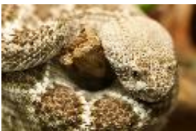
Texas-Klapperschlange, Westl. Diamantklapperschlange - Crotalus atrox BAIRD & GIRARD, 1853