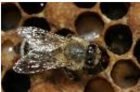
Honigbiene - Apis mellifera Linnaeus, 1758