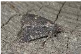
Flokrauteule - Melanchra persicariae persicariae (Linnaeus, 1761)