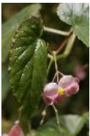
Schiefblatt - Begonia naumaniensis Irmsch.