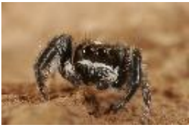
Pellenes arciger (Walckenaer, 1837), adultes Männchen