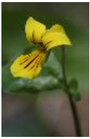
Zweiblütiges Veilchen, Gelbes Veilchen oder Gelbes Bergveilchen - Viola biflora L.