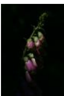
Roter Fingerhut - Digitalis purpurea Linnaeus, 1753