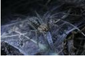
Agelena labyrinthica (Clerck, 1757) - Trichterspinne