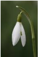
Kleines Schneeglöckchen, Gewöhnliches Schneeglöckchen - Galanthus nivalis L.