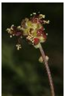
Kleine Wiesenknopf, Blutstillerin, Blutströpfchen, Braunelle, Drachenblut, Falsche Bibernelle, Herrgottsworte, Körbelskraut, Kältelkraut, Rote Bibernelle, Sperberkraut, Wiesenbibernelle, Wurmkraut, Becherblume, Kleine Bibernelle, Welsche Bibernelle,