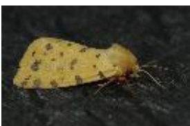
Purpurbär, Stachelbeerbär - Rhyparia purpurata (Linnaeus, 1758)