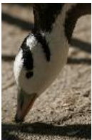
Streifengans - Anser indicus (Latham, 1790).