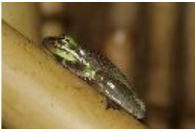
Karolina-Laubfrosch, Amerikanischer Laubfrosch - Hyla cinerea (Schneider, 1799)