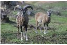
Europäischer Mufflon - Ovis orientalis musimon (Pallas, 1811)/ O. aries Linnaeus, 1758