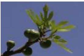
Echte Feige - Ficus carica L.