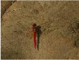
Scarlet Percher Dragonfly - Diplacodes haematodes (Burmeister, 1839)