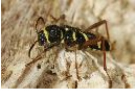
Echter Widderbock, Gemeiner Widderbock oder Wespenbock - Clytus arietis (Linnaeus, 1758), Männchen