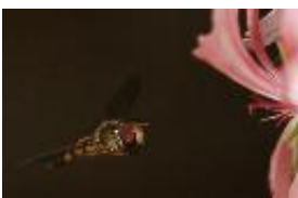
Hainschwebfliege - Episyrphus balteatus (De Geer, 1776)