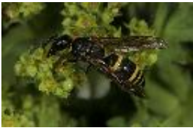
Lehmwespenart - Allodynerus delphinalis (Giraud, 1866)