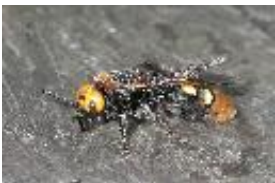
Dolchwespe - Scolia sp.