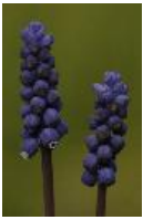
Armenische Traubenhyazinthe - Muscari armeniacum Baker