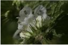
Weiße Taubnessel - Lamium album L., 1753