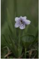
Sumpf-Veilchen - Viola palustris Linné, 1753