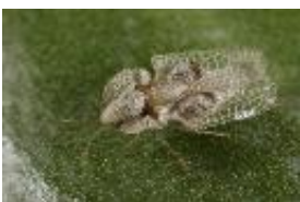
Platanennetzwanze - Corythucha ciliata (Say, 1832)