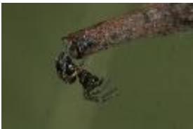
Araeoncus humilis (Blackwall, 1841), adultes Weibchen