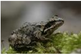
Grasfrosch - Rana temporaria Linnaeus, 1758.