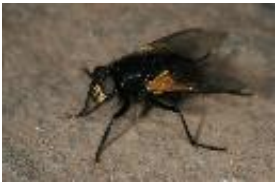
Mesembrina meridiana (Linnaeus, 1758)