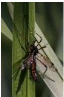
Dictenidia bimaculata (Linnaeus, 1761)