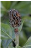
Magnolie - Magnolia sp.