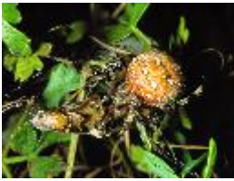
Vierfleck-Kreuzspinne - Araneus quadratus Clerck, 1758, adultes Weibchen mit erbeutem Grashüpfer