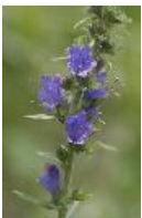
Gewöhnlicher Natternkopf - Echium vulgare L.