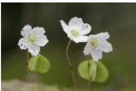
Wald-Sauerklee - Oxalis acetosella L.