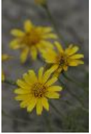
Thymophylla tenuiloba (DC.)