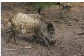
Wildschwein - Sus scrofa Linnaeus, 1758