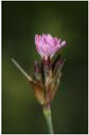
Pannonische Karthäuser-Nelke, Kleinblütige Karthäuser-Nelke - Dianthus carthusianorum L., 1753 ( D. carthusianorum subsp. pontederae (Kerner))