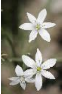
Dolden-Milchstern - Ornithogalum umbellatum L.