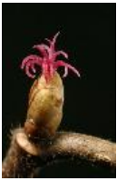
Gemeine Hasel, Haselstrauch, Haselnussstrauch - Corylus avellana L., weibliche Blüte