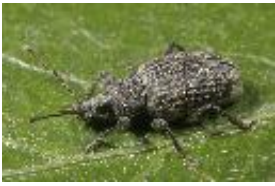
Otorhynchus (Dorymerus) sulcatus (Fabricius, 1775), Weibchen