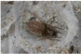
Clubiona frisia Wunderlich & Schuett, 1995, adultes Weibchen