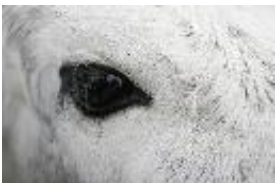
Zebu, Buckelrind - domestizierte Art Bos primigenius Bojanus, 1827