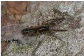
Segestria senoculata (Linnaeus, 1758), subadultes Weibchen