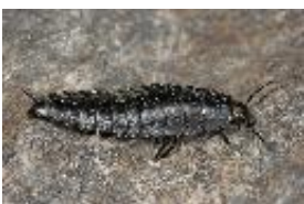
Trister Aaskäfer - Silpha tristis Illiger, 1798, Larve