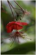
Hibiscus grandidieri var. greveanus (Baill.) Hochr.