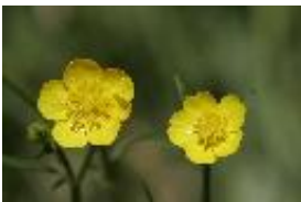
Scharfer Hahnenfuß - Ranunculus acris L.