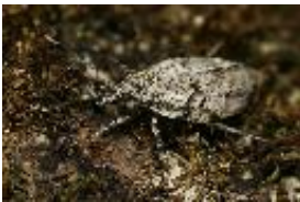
Buchenmotte, Sängerin - Diurnea fagella (Denis & Schiffermüller 1775), adultes Weibchen