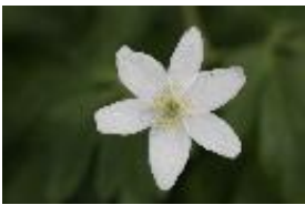
Buschwindröschen - Anemone nemorosa L.