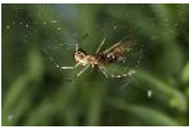
Linyphia triangularis (Clerck, 1758), adultes Weibchen mit erbeuteter Fliege