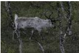
Ren, Rentier - Rangifer tarandus (Linnaeus, 1758)