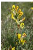
Regensburger Zwergginster, Zwillings-Zwergginster, Regensburger Zwerggeißklee, Seidenhaar-Zwergginster - Chamaecytisus ratisbonensis (Schaeff.) Rothm.