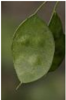
Einjähriges Silberblatt, Judas-Silberling, Judas-Pfennig, Judas-Taler, Silbertaler, (Garten-) Mondviole - Lunaria annua L.