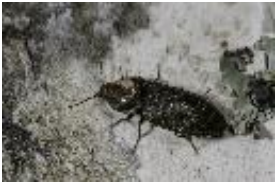
Seidenhaariger Schnellkäfer - Prosternon tessellatum (Linnaeus, 1758)