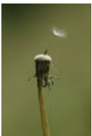
Gewöhnliche Löwenzahn - Taraxacum sect. Ruderalia Kirschner, H.Øllg. & Štěpánek, einzelne Achäne