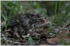
Erdkröte - Bufo bufo (Linnaeus, 1758) in Kopula.