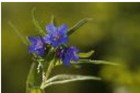
Blauroter Steinsame, Blaurote Rindszunge, Purpurblauer Steinsame - Buglossoides purpurocaerulea (L.) I. M. Johnst.