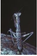
Ameles heldreichi Brunner von Wattenwyl, 1882, Nymphe