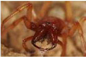
Dysdera crocata C.L. Koch, 1838, adultes Weibchen