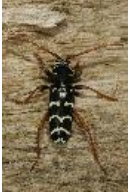
Eichenwidderbock, Wespenbock oder Eichenzierbock - Plagionotus arcuatus (Linnaeus, 1758), Männchen