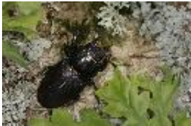
Hirschkäfer - Lucanus cervus (Linnaeus, 1758), Weibchen