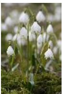
Frühlings-Knotenblume, Märzenbecher, Märzbecher, Großes Schneeglöckchen - Leucojum vernum L.