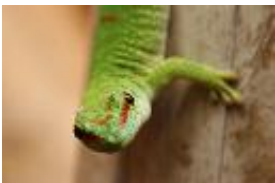
Madagaskar-Taggecko - Phelsuma madagascariensis GRAY, 1831