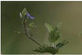
Gamander-Ehrenpreis - Veronica chamaedrys L.