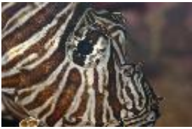
Pazifischer Rotfeuerfisch - Pterois volitans (Linnaeus, 1758)