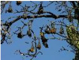
Graukopf-Flughund, Greyheaded Flying-fox - Pteropus poliocephalus Temminck, 1825. Kolonie am Schlafbaum hängend.