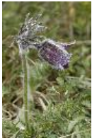
Wiesen-KuhSchelle, Wiesen-Küchenschelle - Pulsatilla pratensis (L.) Mill. (subsp. P.p. nigricans )