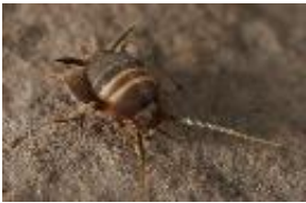
Ameisengrille - Myrmecophilus acervorum (Panzer, 1799), adultes Weibchen