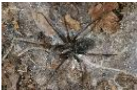
Große Winkelspinne, „Hausspinne“ - Tegenaria atrica C.L. Koch, 1843, Weibchen