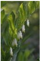
Echtes Salomonssiegel, Wohlriechende Weißwurz - Polygonatum odoratum (Mill.) Druce