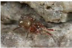
Robertus lividus (Blackwall, 1836), winteraktives, adultes Weibchen