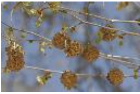
Amerikanische Platane, Westliche Platane - Platanus occidentalis L.