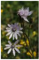
Rote Schwarzwurzel, Rotblumige Schwarzwurzel, Violette Schwarzwurzel - Scorzonera purpurea Waldst. et Kit.