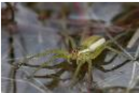
Gerandete Jagdspinne - Dolomedes fimbriatus (Clerck, 1804)