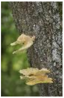
Schwefelporling - Laetiporus sulphureus (Bull.) Murrill 1920