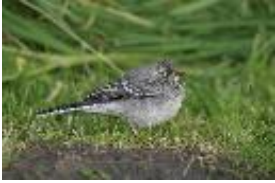
Bachstelze - Motacilla alba Linnaeus, 1758, Jungvogel