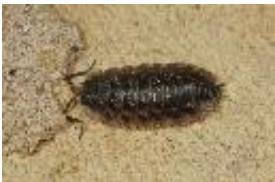
Mauerassel - Oniscus asellus Linnaeus, 1758