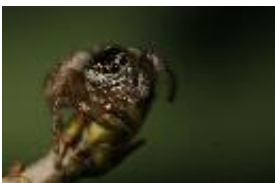
Evarcha arcuata (Clerck, 1758), adultes Weibchen