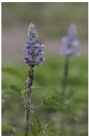
Mehliger Salbei - Salvia farinacea Benth.