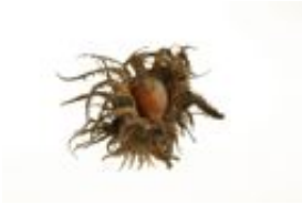
Baum-Hasel - Corylus colurna L., reife Nuss