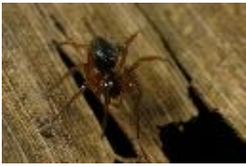
Oedothorax agrestis (Blackwall, 1853), adultes Weibchen