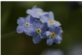
Wald-Vergissmeinnicht - Myosotis sylvatica Ehrh. ex Hoffmann