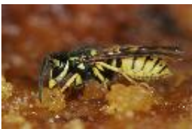
Deutsche Wespe - Vespula germanica (Fabricius, 1793)