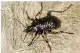
Kleiner Puppenräuber - Calosoma inquisitor (Linnaeus, 1758), Männchen