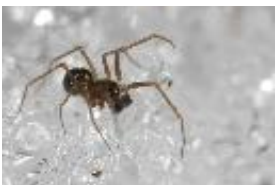
Diplostyla concolor (Wider, 1834), winteraktives, adultes Männchen