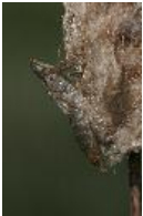
Exuvie der Großen Königslibelle - Anax imperator Leach, 1815, Weibchen