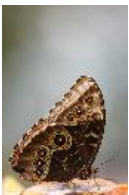
Achilles Morpho - Morpho achilles Linnaeus, 1758