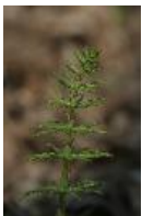
Wald-Schachtelhalm - Equisetum sylvaticum L.