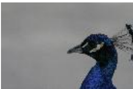
Blauer Pfau - Pavo cristatus Linnaeus, 1758. Männchen.