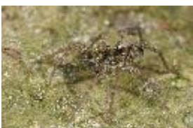
Pardosa sp., subadultes Männchen