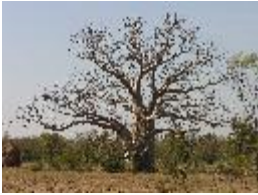
Australischer Baobab - Adansonia gregorii F.Muell.