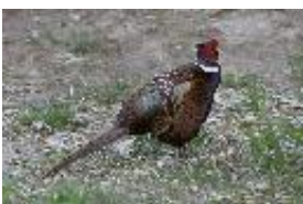
Fasan - Phasianus colchicus Linnaeus 1758. Männchen.