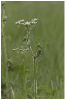
Wiesen-Bärenklau - Heracleum sphondylium L.