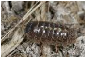
Rollassel - Armadillidium vulgare (Latreille, 1804), Weibchen