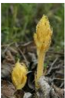
Sommerwurz - Orobancha sp.