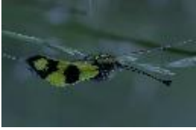
Libelloides macaronius (Scopoli, 1763)