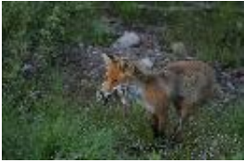
Rotfuchs - Vulpes vulpes (Linnaeus, 1758)