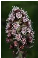
Gewöhnliche Pestwurz, Bach-Pestwurz, Rote Pestwurz - Petasites hybridus (L.) Gaertn.