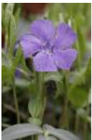
Kleines Immergrün - Vinca minor L.