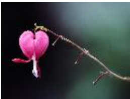
Tränendes Herz, Zweifarbige Herzblume Lamprocapnos spectabilis (L.) Fukuhara