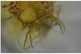
Veränderliche Krabbenspinne - Misumena vatia (Clerck, 1758), adultes Weibchen