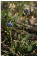
Echte Kugelblume, Hochstängelige Kugelblume - Globularia punctata Lapeyr. (syn. G. bisnagarica L.)