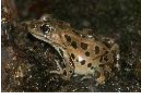
Leopardfrosch - Rana pipiens (Schreber, 1782)