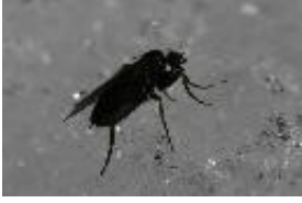
Buckelfliege - Triphleba sp. im Schnee