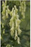
Wolfs-Eisenhut, Gelber Eisenhut - Aconitum lycoctonum L.