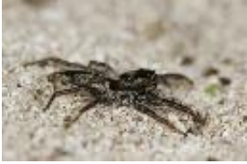
Menemerus taeniatus (L. Koch, 1867), adultes Weibchen, linker Pedipalpus fehlt.