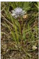
Herzblättrige Kugelblume - Globularia cordifolia L.