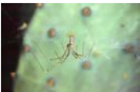
Holocnemus pluchei (Scopoli, 1763), adultes Weibchen