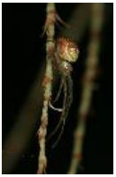
Linyphia tenuipalpis Simon, 1884, adultes Weibchen