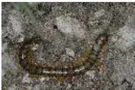
Gürtelskolopender, Europäischer Riesenläufer - Scolopendra cingulata Latreille, 1789.