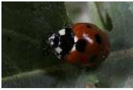
Ameisen-Siebenpunkt - Coccinella (Coccinella) magnifica Redtenbacher, 1843