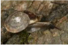
Steinpicker - Helicigona lapicida (Linnaeus, 1758)