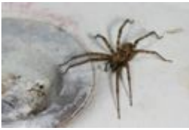
Rostrote Winkelspinne - Malthonica ferruginea (Panzer, 1804), syn. Tegenaria f. , adultes Weibchen