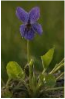
Duftveilchen, Märzveilchen, Wohlriechendes Veilchen - Viola odorata L.