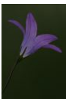
Wiesen-Glockenblume - Campanula patula L.