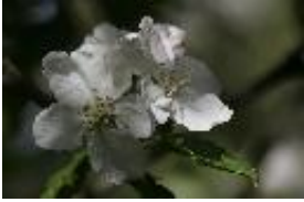
Apfelbaum, Kulturapfel - Malus domestica Borkh., Roter Boskoop