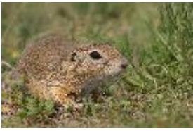
Europäisches Ziesel - Spermophilus citellus (Linnaeus, 1766)