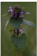
Purpurrote Taubnessel, Rote Taubnessel - Lamium purpureum L.