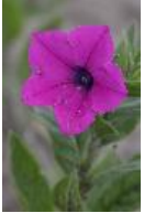
Violette Petunie - Petunia integrifolia (Hook.) Schinz & Thellung