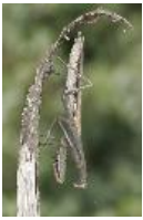
Europäische Gottesanbeterin - Mantis religiosa (Linnaeus, 1758), adultes Weibchen