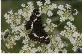
Landkärtchen - Araschnia levana (Linnaeus 1758), Sommergeneration