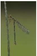
Weidenjungfer - Lestes viridis (Vander Linden, 1825), Weibchen