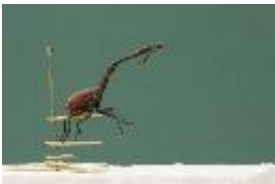
Präparat des Giraffenkäfers - Trachelophorus giraffa Jekel, 1860