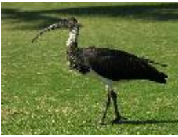
Stachelibis - Threskiornis spinicollis (Jameson, 1835)