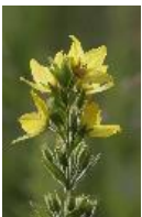
Punktierter Gilbweiderich, Goldfelberich oder Drüsiger Gilbweiderich - Lysimachia punctata L.