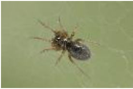
Erigone atra Blackwall, 1833, adultes Weibchen