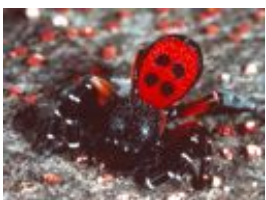
Rote Röhrenspinne - Eresus cinnaberinus (Olivier, 1789), drohendes, adultes Männchen