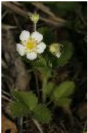
Hügel-Erdbeere, Knackelbeere, Knack-Erdbeere - Fragaria viridis (Duch.) West.