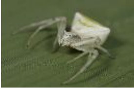
Thomisus onustus (Walckenaer, 1806), adultes Weibchen