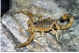
Gelber Skorpion - Buthus occitanus (Amoreux, 1789)