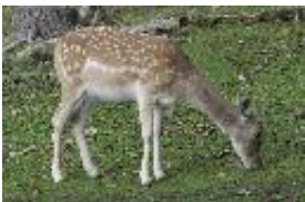
Damhirsch - Dama dama (Linnaeus, 1758)