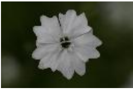
Vierzähliger Strahlensame - Silene pusilla Waldst. & Kit.