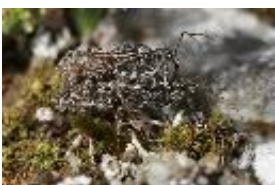
Coranus subapterus (De Geer, 1773), Kopula