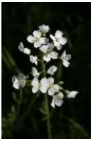
Wiesen-Schaumkraut - Cardamine pratensis L.