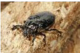
Eremit, Juchtenkäfer - Osmoderma eremita (Scopoli, 1763)