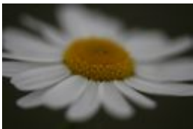
Geruchlose Kamille - Tripleurospermum maritimum subsp. inodorum (Merat) M.Laínz, syn.: Tripleurospermum perforatum , Matricaria inodora Tripleurospermum L.