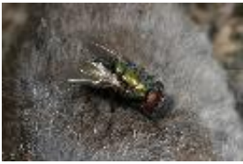
Goldfliege - Lucilia sericata (Meigen, 1826)