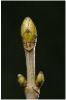
Bergahorn - Acer pseudoplatanus L., Knospen