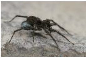
Pardosa amentata (Clerck, 1757), Weibchen mit Kokon