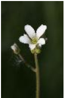
Knöllchen-Steinbrech - Saxifraga granulata L. 1753