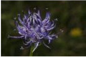
Kugelige Teufelskralle - Phyteuma orbiculare L.