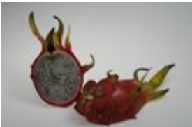
Drachenfrucht, Pitahaya, Pitaya - Hylocereus undatus (Haw.) Britt. & Rose, aufgeschnittene Frucht