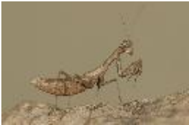
Ameles decolor (Charpentier, 1825), adultes Weibchen