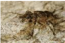
Eichen-Zangenbock, Großer Laubholz-Zangenbock, Großer Zangenbock - Rhagium (Megarhagium) sycophanta (Schrank, 1781), Männchen