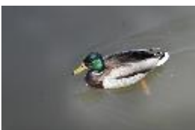
Stockente - Anas platyrhynchos (Linnaeus, 1758). Männchen.