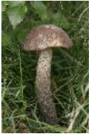
Birkenpilz, Birken-Röhrling - Leccinum scabrum (Bull.)