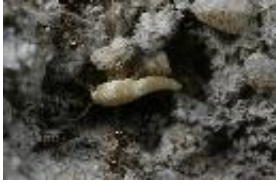
Ameisenfischchen - Atelura sp.