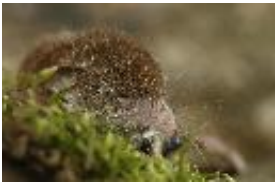
Hausspitzmaus - Crocidura russula (Hermann, 1780)