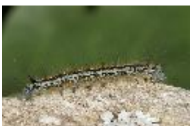
Malacosoma neustria Linnaeus, 1758 - Ringelspinner