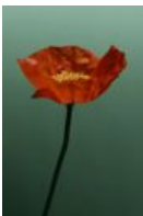
Island-Mohn - Papaver nudicaule L.