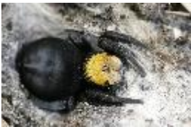
Gelbstirn-Röhrenspinne - Eresus sp.