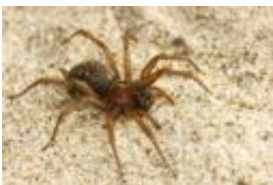
Agelena gracilens C.L. Koch, 1841, subadultes Weibchen