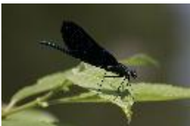
Blaufügel-Prachtlibelle - Calopteryx virgo Linné, 1758 - Männchen