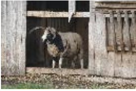
Vierhornschaf, Jakobschaf - Ovis [ammon] aries Linnaeus, 1758