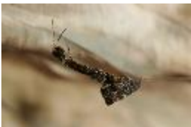
Federfußspinne - Uloborus plumipes Lucas, 1846, adultes Weibchen