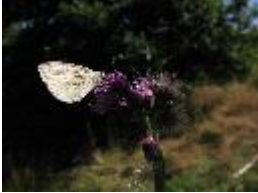
Grünader-Weißling, Hecken-Weißling, Raps-Weißling - Pieris napi (Linnaeus, 1758)