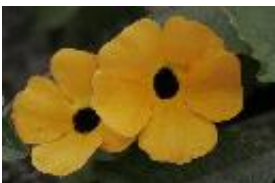
Schwarze Susanne - Thunbergia alata (Bojer) ex Sims