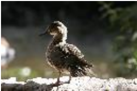
Gluckente - Anas formosa Georgi, 1775. Weibchen.