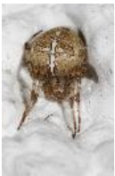
Gartenkreuzspinne - Araneus diadematus Clerck, 1758, adultes Weibchen