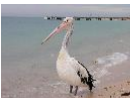
Brillenpelikan - Pelecanus conspicillatus Temminck, 1824