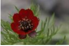
Sommer-Adonisröschen, Blutaube, Blutströpfchen, Sommerblutströpfchen, Kleines Teufelsauge - Adonis aestivalis L.