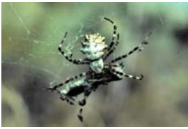
Zebraspinne - Argiope lobata (Pallas, 1772), adultes Weibchen mit Beute