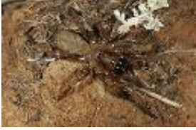
Falltürspinne - Iberesia brauni (L. Koch, 1882), adultes Weibchen