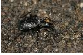
Gewöhnlicher Schaufelläufer - Cychrus caraboides (Linnaeus, 1758), Weibchen