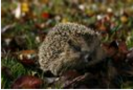
Braunbrustigel - Erinaceus europaeus Linnaeus, 1758