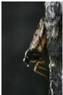
Schnepfenfliege - Rhagio scolopaceus (Linnaeus, 1758), Weibchen