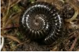
Cylindroiulus londinensis (Leach, 1814)