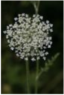
Wilde Möhre - Daucus carota subsp. carota L., Blütendolde