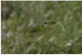
Torf-Mosaikjungfer - Aeshna juncea (Linnaeus, 1758), patrouillierendes Männchen