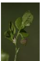
Heidelbeere, Blaubeere - Vaccinium myrtillus L.