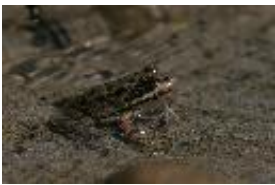
Seefrosch - Rana ridibunda Pallas, 1771