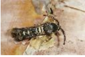
Himbeerglasflügler - Pennisetia hylaeiformis (Laspeyres, 1801)