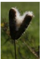
Breitblättriger Rohrkolben - Typha latifolia L. - Blütenstand