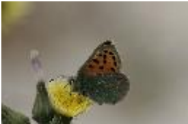
Tomares ballus (Fabricius, 1787).