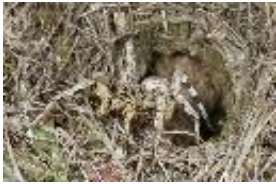
Lycosa narbonensis Walckenaer, 1806, adultes Weibchen