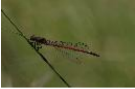
Frühe Adonislibelle - Pyrrhosoma nymphula (Sulzer, 1776), Männchen