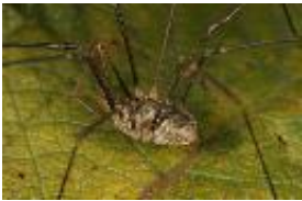
Phalangium opilio Linnaeus, 1761 - Weberknecht