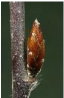
Rotbuche - Fagus sylvatica L., Knospe