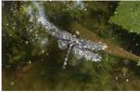
Kleine Moosjungfer - Leucorrhinia dubia (Vander Linden, 1825), totes Weibchen