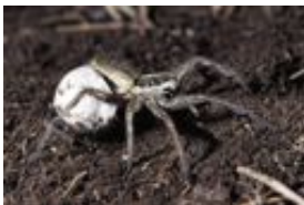
Schwarzbäuchige Tarantel - Hogna radiata (Latreille, 1817), Weibchen mit Kokon