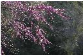
Judasbaum - Cercis sp.