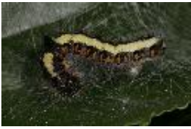
Pfeileule - Acrionicta psi (Linnaeus, 1758), von einer Braconidae (Brackwespe) parasitierte Raupe