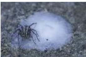
Thanatus sp., adultes Weibchen auf Eigelege