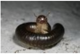
Pachyiulus varius (Fabricius, 1781)