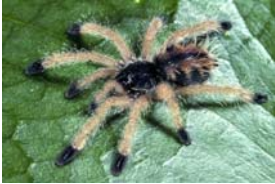
Vogelspinne - Avicularia avicularia (Linnaeus, 1758), juveniles Tier