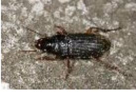
Behaarter Schnellläufer - Pseudoophonus (Pseudoophonus) rufipes (De Geer, 1774), Männchen