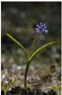
Zweiblättriger Blaustern, Sternhyazinthe, Meerzwiebel, Josefsblümerl - Scilla bifolia L.