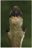
Gemeine Esche - Fraxinus excelsior L., Knospen