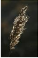
Schilfrohr - Phragmites australis (Cav.) Trin. ex Steud. (syn. Phragmites communis Trin.)