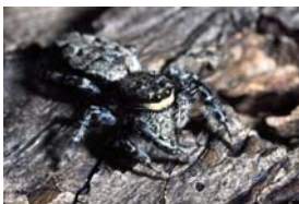
Marpissa muscosa (Clerck, 1758), adultes Weibchen