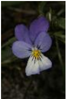
Wildes Stiefmütterchen, Strand-Stiefmütterchen, Muttergottesschuh, Mädchenaugen, Gedenkemein, Schöngesicht, Liebesgesichtli - Viola tricolor L.