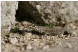
Spanische Mauereidechse - Podarcis hispanica (Steindachner, 1870)