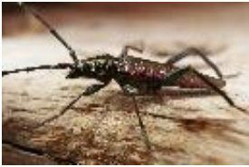
Moschusbock - Aromia moschata (Linné, 1758)