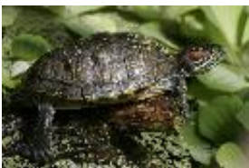
Rotwangen-Schmuckschildkröte Trachemys scripta elegans (Wied-Neuwied, 1839)