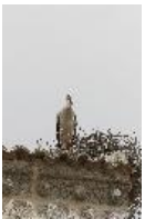
Weißstorch - Ciconia ciconia (Linnaeus, 1758).