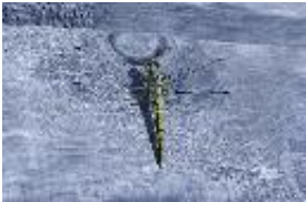
Orthetrum cancellatum Linnaeus, 1758 - Großer Blaupfeil (Weibchen)