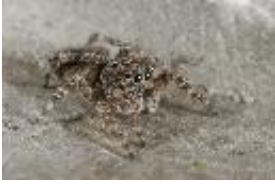
Sitticus pubescens (Fabricius, 1775), adultes Weibchen