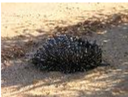
Kurzchnabeligel - Tachyglossus aculeatus (Shaw, 1792)