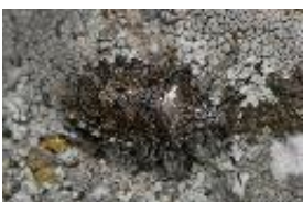
Beerenwanze - Dolycoris baccarum (Linnaeus, 1758)