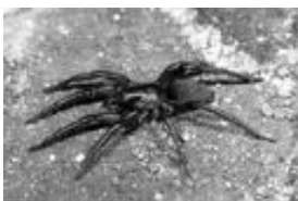
Gnaphosa bicolor (Hahn, 1833), adultes Weibchen