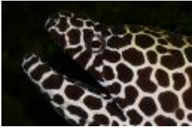
Große Netzmuräne - Gymnothorax favagineus Bloch & Schneider, 1801