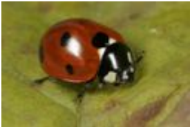
Siebenpunkt-Marienkäfer - Coccinella septempunctata L., 1758