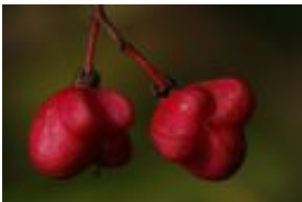
Gewöhnlicher Spindelstrauch, Europäisches Pfaffenhütchen, Pfaffenkäppchen, Pfaffenkapperl, Spillbaum oder Spindelbaum - Euonymus europaeus L.