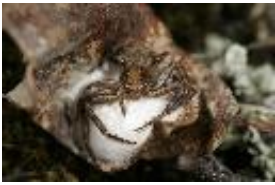
Xysticus cristatus (Clerck, 1758), Weibchen mit Kokon