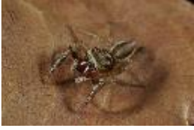
Icius hamatus (C.L. Koch, 1846), adultes Männchen