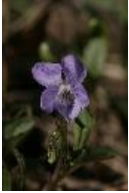
Hain-Veilchen - Viola riviniana Rchb.