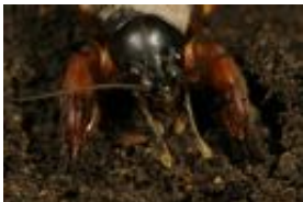
Europäische- oder Gemeine Maulwurfsgrille, Werre - Gryllotalpa gryllotalpa (Linnaeus, 1758), adultes Weibchen