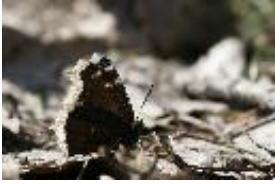
Trauermantel - Nymphalis antiopa (Linnaeus, 1758)