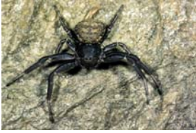
Xysticus ninnii (Thorell, 1872), adultes Männchen