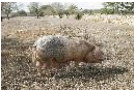
Hausschwein - domestizierte Art Sus scrofa Linnaeus, 1758.