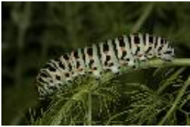
Schwalbenschwanz - Papilio machaon Linnaeus, 1758. Raupe.