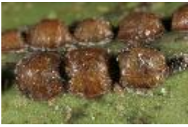
Coccidae, Napfschildläuse auf Brexia sp. Blatt