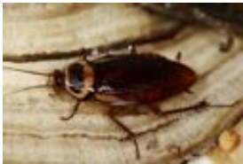
Australische Schabe - Periplaneta australasiae (Fabricius, 1775)