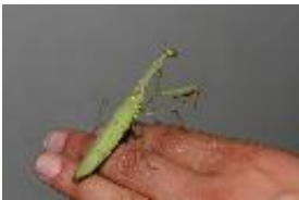
Europäische Gottesanbeterin - Mantis religiosa (Linnaeus, 1758), adultes Weibchen