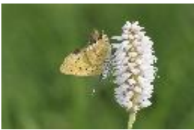
Dukatenfalter - Lycaena virgaureae (Linnaeus, 1758), Weibchen