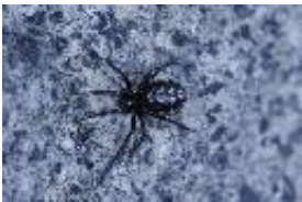
Steatoda albomaculata (De Geer, 1778), adultes Weibchen