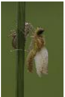
Schwarze Heidelibelle - Sympetrum danae (Sulzer, 1776), Weibchen bei der Häutung