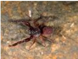
Palpimanus sp., adultes Männchen