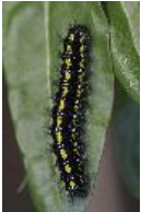
Schönbär - Callimorpha dominula (Linnaeus, 1758), Raupe.