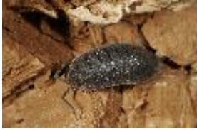
Kellerrassel - Porcellio scaber Latreille, 1804