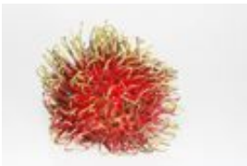
Rambutan - Nephelium lappaceum L., 1767, Frucht