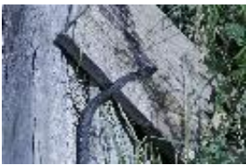
Natrix tessellata (Laurenti, 1768) - Würfelnatter