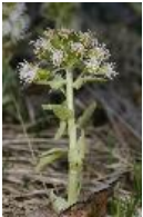
Weiße Pestwurz - Petasites albus (L.) Gaertner