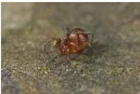
Zodarion rubidum Simon, 1914, adultes Weibchen