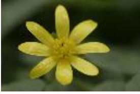
Scharbockskraut - Ranunculus ficaria L.