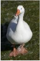
Hausgans - Anser anser domest. (Linné, 1758).