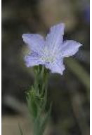
Südfranzösischer Lein - Linum narbonense L.