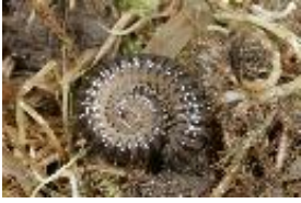
Haken-Feldschnurfüßer - Unciger foetidus (C.L.Koch, 1838)