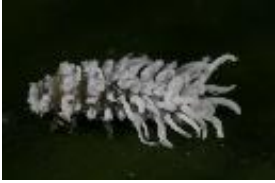
Larve eines Kugelmarienkäfers - Scymnus sp.