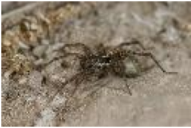
Pardosa monticola (Clerck, 1758), Weibchen mit Kokon