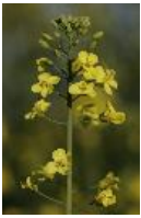
Raps - Brassica napus L.