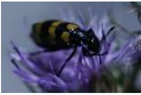
Mylabris variabilis (Pallas, 1758) - Gestreifter Blasenkäfer