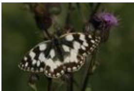
Damenbrett - Melanargia galathea (Linnaeus, 1758)