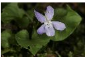
Wald-Veilchen - Viola reichenbachiana Boreau