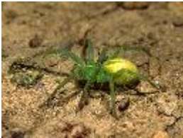
Grüne Huschspinne - Micrommata virescens (Clerck, 1758), adultes Weibchen