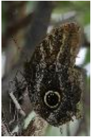
Bananenfalter, Eulenaugenfalter - Caligo eurilochus (Cramer, 1775)