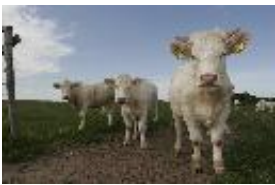
Hausrind - domestizierte Art Bos primigenius Bojanus, 1827.