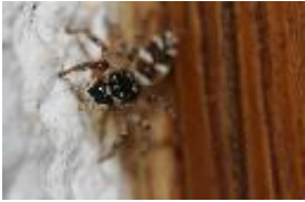
Zebraspringspinne, Harlekingspringspinne - Salticus scenicus (Clerck, 1758), subadultes Weibchen