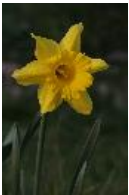
Gelbe Narzisse, Osterglocke, Osterglöckchen, Falscher Narzissus, Trompeten-Narzisse, Märzenbecher - Narcissus pseudonarcissus L.