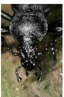
Lederlaufkäfer - Carabus (Procrustes) coriaceus Linnaeus, 1758, Männchen.