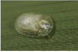
Cassida (Cassida) sanguinolenta O.F. Müller, 1776, Weibchen