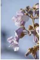
Paulownie, Blauglockenbaum - Paulownia tomentosa (Thunb.) Siebold & Zucc. ex Steud., 1841.