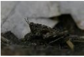
Säbeldornschrecke - Tetrix subulata (Linnaeus, 1758)