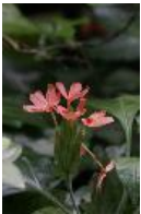
Nil-Crossandra - Crossandra nilotica Oliver