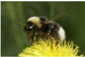
Vierfarbige Kuckuckshummel - Bombus quadricolor (Lepelletier, 1832)