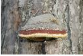
Fichtenporling, Rotrandiger Baumschwamm - Fomitopsis pinicola (Sw.) P. Karst., 1881