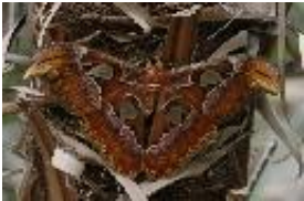
Atlasspinner - Attacus atlas Linnaeus, 1758