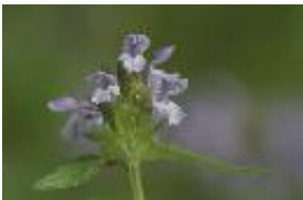
Kleine Brunelle, Kleine Braunelle oder Gewöhnliche Braunelle - Prunella vulgaris L.