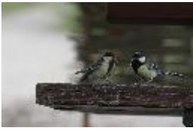
Kohlmeise - Parus major Linnaeus, 1758, Elternteil und Jungtier