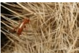
Igfelfloh - Archaeopsylla erinacei (Bouché, 1835)