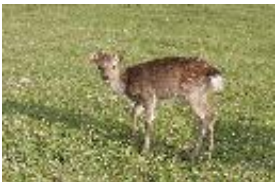
Sikahirsch - Cervus nippon Temminck, 1838. Kalb.