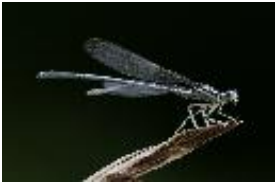
Blaue Federlibelle, Gemeine Federlibelle - Platycnemis pennipes (Pallas, 1771), Männchen