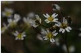
Frühlings-Hungerblümchen - Erophila verna (L.) DC.