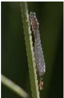
Große Pechlibelle - Ischnura elegans (Vander Linden, 1820), frisch geschlüpftes Weibchen