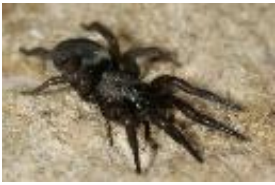
Scotophaeus scutulatus (L. Koch, 1866), adultes Weibchen