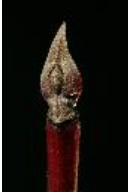
Blutroter Hartriegel, Roter Hartriegel, Rotes Beinholz, Hundsbeere, Roter Hornstrauch - Cornus sanguinea L., Knospe