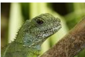
Grüne Wasseragame, Chinesischer Wasserdrachen - Physignathus cocincinus CUVIER, 1829