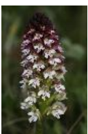
Brand-Knabenkraut - Neotinea ustulata (L.) , syn. Orchis ustulata L., 1753