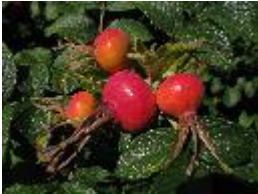
Hagebutte - Rosa sp.