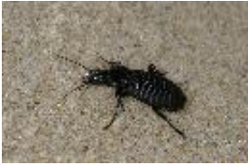
Große Grabkäfer, Gestreifte Schulterläufer - Pterostichus (Platysma) niger (Schaller, 1783)