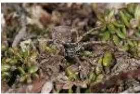
Pardosa palustris (Linnaeus, 1758), adultes Männchen