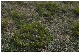
Erd-Segge - Carex humilis Leyss.