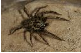
Waldwinkelspinne - Malthonica silvestris (L. Koch, 1872), adultes Männchen (syn. Tegenaria s.)