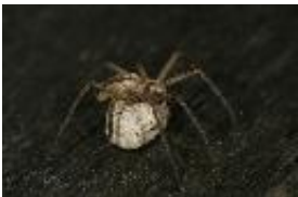
Listspinne - Pisaura mirabilis (Clerck, 1758). Weibchen mit ihrem Kokon.