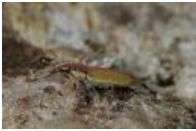
Rüsselkäfer - Lixus sp. kurz nach der Puppenruhe.