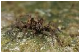
Alopecosa sp., subadultes Weibchen