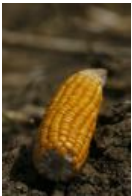
Mais, Kukuruz - Zea mays L., Maiskolben mit gelben Karyopsen