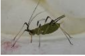
Sitobion fragariae (Walker 1848)