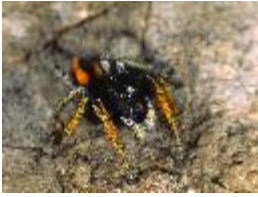
Philaeus chrysops (Poda, 1761), adultes Männchen