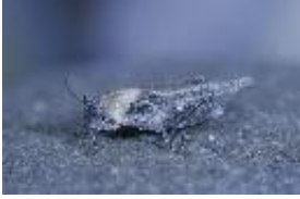
Türks Dornschröcke - Tetrax tuerki Krauss, 1876, adultes Weibchen