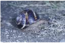
Helix lucorum Linnaeus, 1758 - Gestreifte Weinbergschnecke