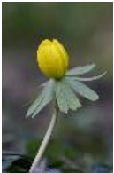
Winterling, Winterstern - Eranthis hyemalis (L.) Salisb.