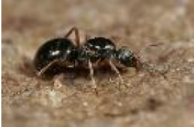
Rote Waldameise - Formica (Formica) rufa Linnaeus, 1761, Königin