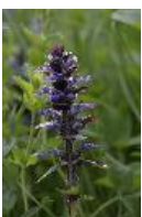
Kriechender Günsel - Ajuga reptans L.